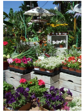
Flores y Plantas

MADRID, 23 de marzo de 2015.- Inspirada en las ferias de plantas y flores de toda Europa, llega por primera vez a Madrid, en su V edición, Botánica Insólita , un original evento que se celebrará los días 8, 9 y 10 de mayo en Matadero Madrid.